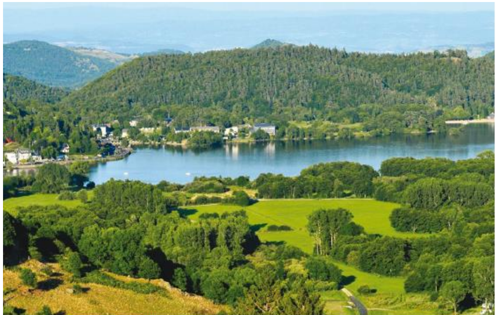
Vue panoramique sur la château de Murol et le lac Chambon