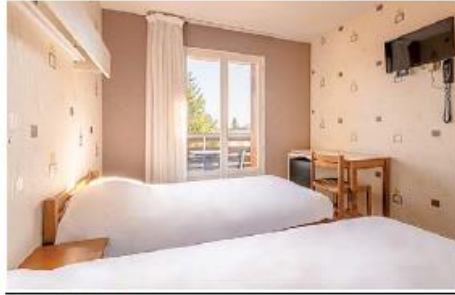
Exemple de chambre