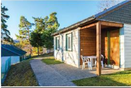
Exemple de logement

850 m d'altitude - Plus beau site d'Auvergne - Un terroir riche et varié Patrimoine naturel exceptionnel - Le Château de Murol et son ambiance médiévale