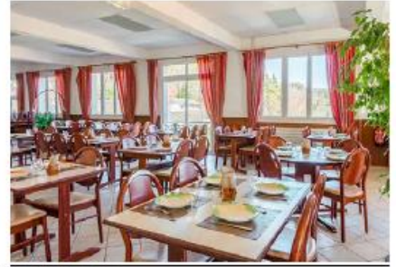
Salle de restaurant